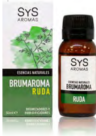
Ruda Ref. 11213