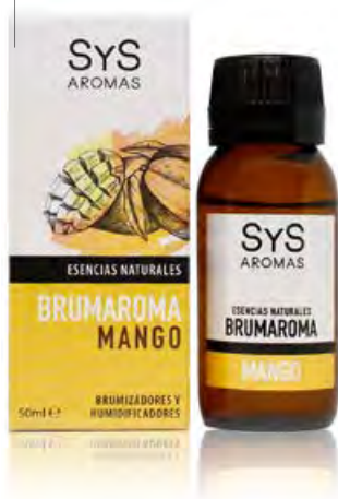
Mango Ref. 11203