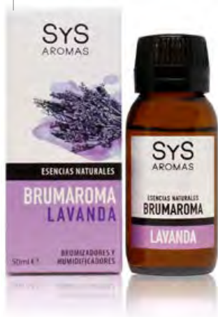
Lavanda Ref. 11206