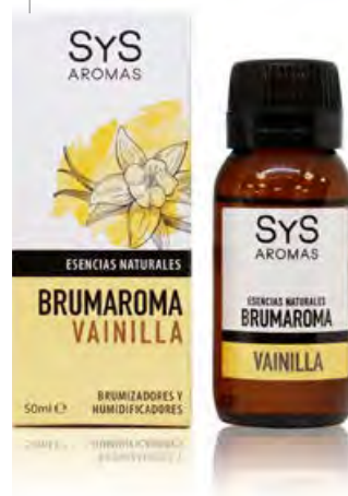
Vainilla Ref. 11210