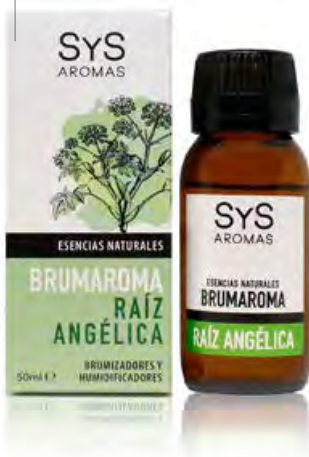
Raíz Angélica Ref. 11204