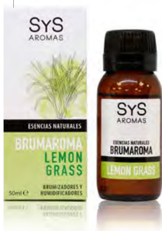
Lemongrass Ref. 11207