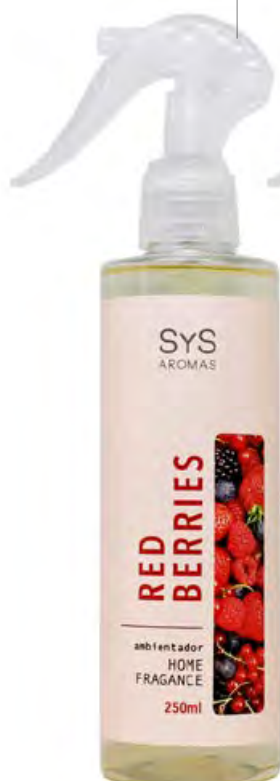
Pulverizador con Pistola Red Berries Ref. 12250