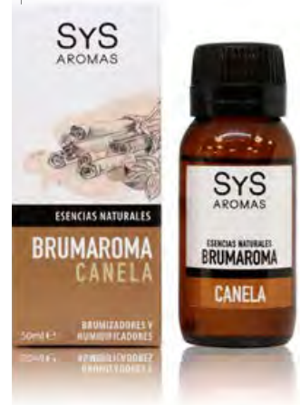
Canela Ref. 11214