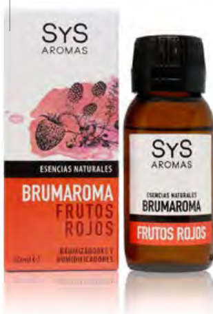
Frutos Rojos Ref. 11201