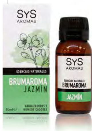
Jazmín Ref. 11208