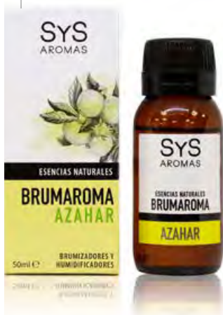
Azahar Ref. 11215