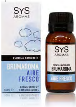
Aire Fresco Ref. 11212