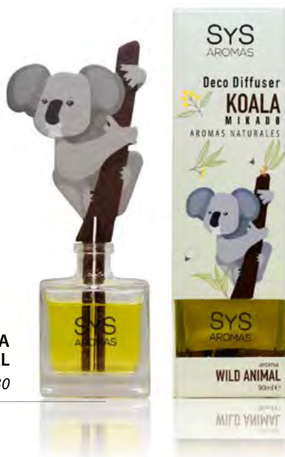
Deco Diffuser KOALA aroma WILD ANIMAL