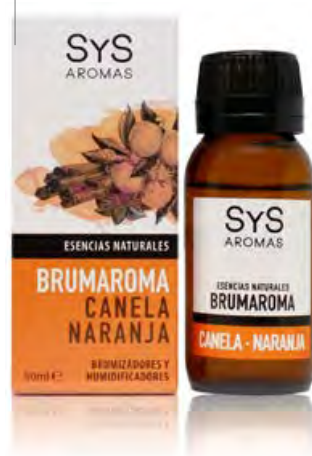
Canela-Naranja Ref. 11202