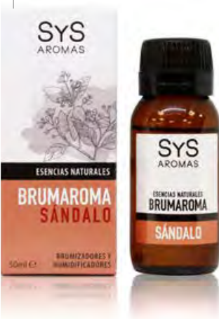
Sándalo Ref. 11209