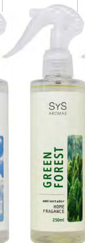
Pulverizador con Pistola Green Forest Ref. 12252