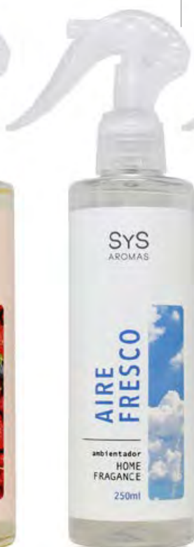
Pulverizador con Pistola Aire Fresco Ref. 12251