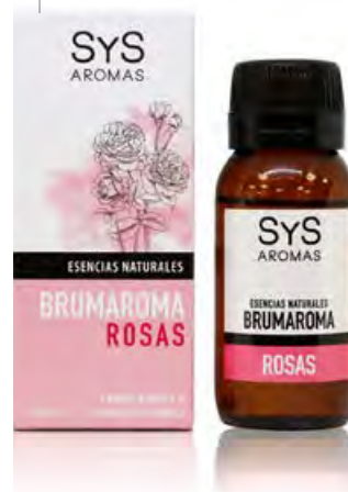
Rosas Ref. 11216